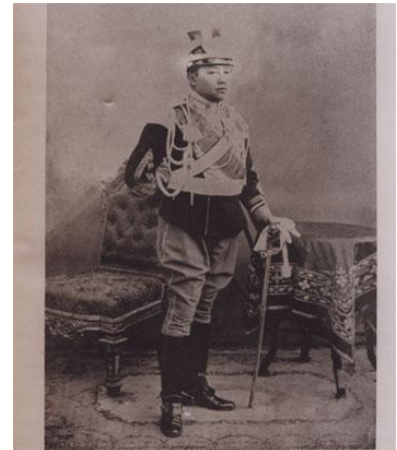
พระบาทสมเด็จพระมงกุฎเกล้าเจ้าอยู่หัว มหาวชิราวุธ พระมงกุฎเกล้าเจ้าอยู่หัว ผู้ทรงดำรงตำแหน่ง สภานายกกรรมการกลางจัดการศึกษา ทั่วพระราชอาณาจักร

พระบาทสมเด็จพระมงกุฎเกล้าเจ้าอยู่หัว ทรงเป็นพระราชโอรส ในพระบาทสมเด็จพระจุลจอมเกล้าเจ้าอยู่หัว และสมเด็จพระศรีพัชรินทราบรมราชินีนาถ (สมเด็จพระนางเจ้าเสาวภาผ่องศรี) เสด็จพระราชสมภพเมื่อวันเสาร์ที่ 1 มกราคม พ.ศ. 2423 ได้รับพระราชทานนามว่า สมเด็จพระเจ้าลูกยาเธอ เจ้าฟ้ามหาวชิราวุธ เมื่อทรงพระเยาว์ได้ศึกษาภาษาไทยกับพระยาศรีสุนทรโวหาร จนแตกฉาน