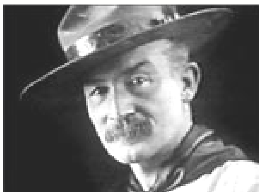
ลอร์ด เบเดน – โพลล์