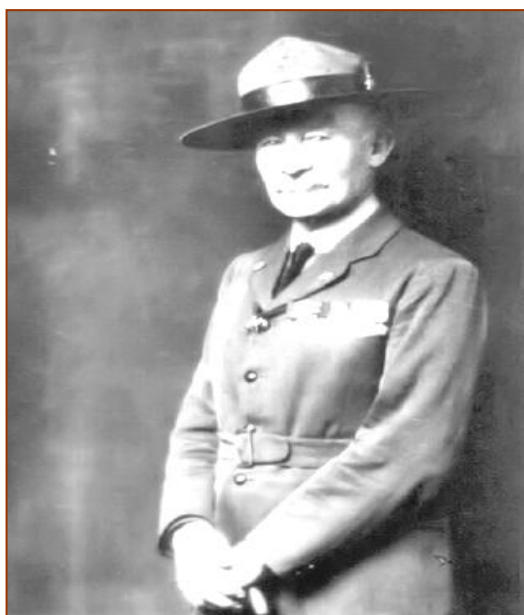
ลอร์ด เบเดน – โพเอลล์